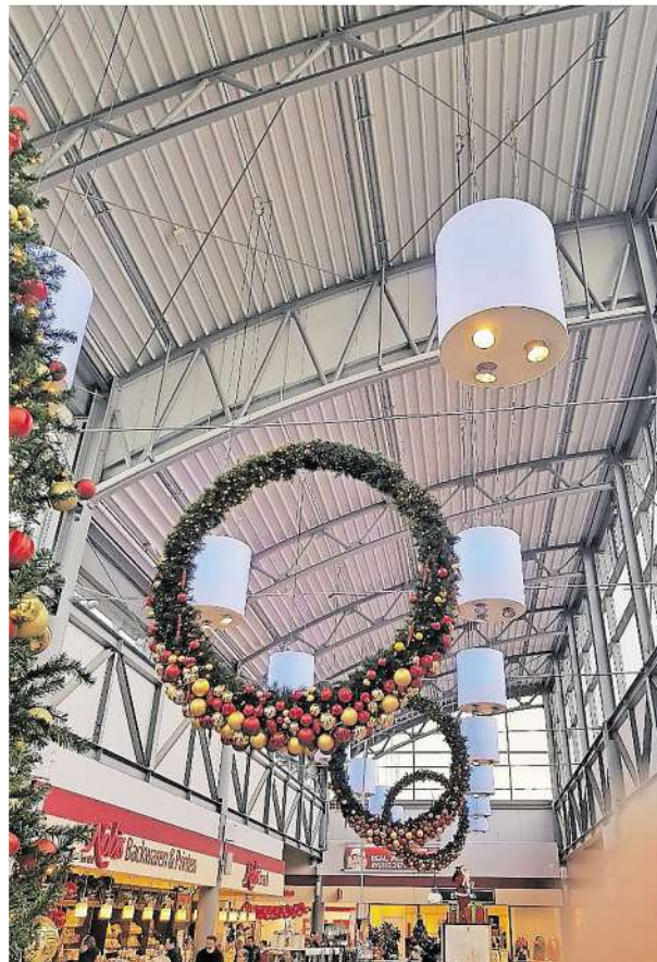
Die Mall des Hirschcenters ist bereits festlich geschmückt.

In der Weihnachtsbäckerei gibt's so manche Leckerei!