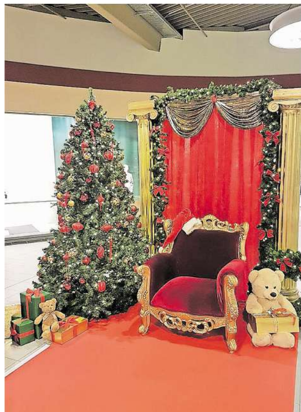
Sein Stuhl ist schon da – auch in diesem Jahr macht der Nikolaus zwei Abstecher ins Hirschcenter, jeweils verbunden mit einer Foto-Aktion.